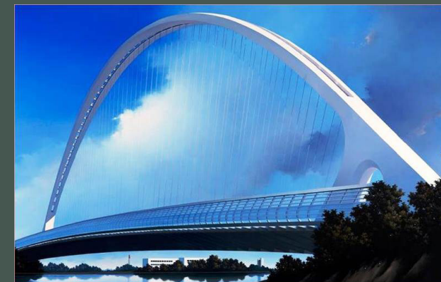
Angelo Davoli, "Calatrava Bridge", dipinto olio su tela, 2009 (cm 130 x cm 240) Collezione Fondazione Manodori Reggio Emilia